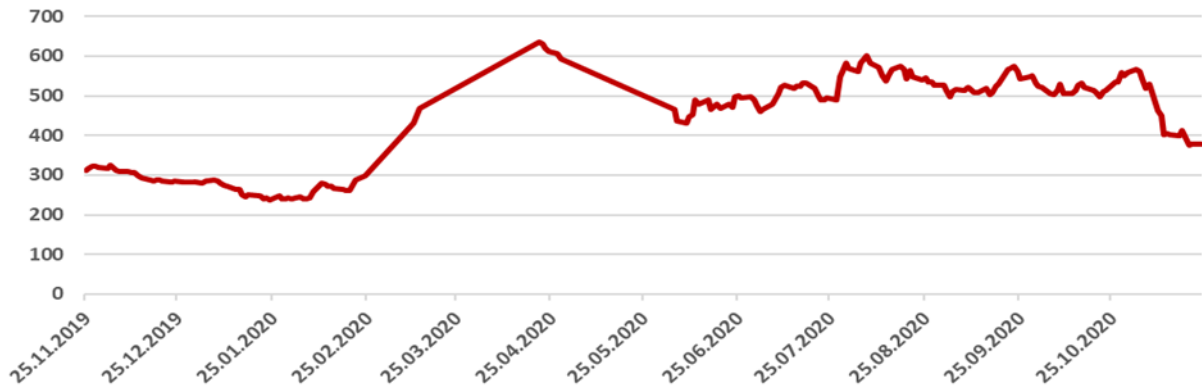
Türkiye 5 Yıllık CDS Primi