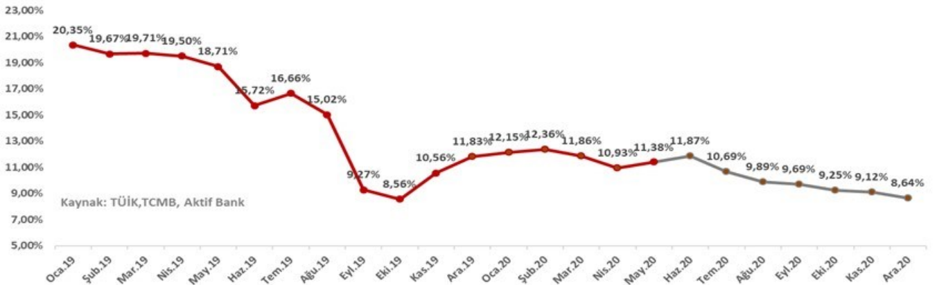
Enflasyonun yıllık değişimde Haziran ayında tepe yapmasını bekliyoruz.