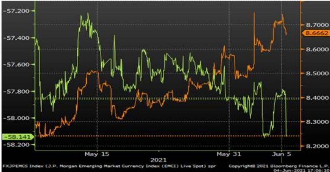
TL vs. EMFX

Döviz Kurları: Hafta boyunca veri takviminin etkisinde kazançlarını geri veren döviz kurları ABD istihdamının beklendiği kadar artış göstermemesi üzerine USD'ye karşı tekrar değer kazandı. Türk Lirası ise Haziran ayındaki negatif ayrışmasını sürdürüyor.